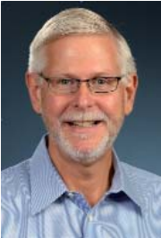
Prof. Brian Meacham

Entre los ponentes internacionales más destacados se encuentran/Among the most prominent international speakers include: